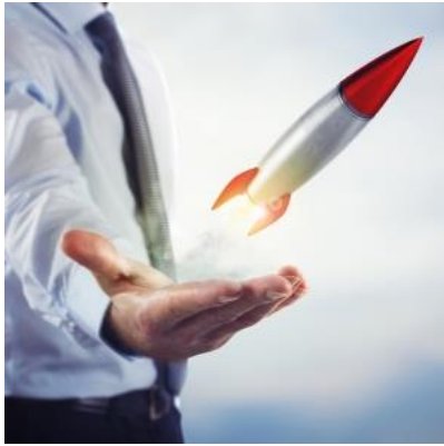
Vom Mauersegler zum Überflieger: Anleger schenken dem Apus Revalue Fonds ihr Vertrauen.

Vor einem Jahr berichteten wir zum ersten Mal über den Apus Revalue Fonds. Der Mauersegler-Fonds blickt auf ein erfolgreiches Investmentjahr zurück und konnte sein Fondsvolumen allein in 2017 verdoppeln. Höchste Zeit, nochmal Bilanz zu ziehen.