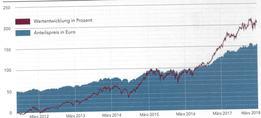
KURS- UND WERTENTWICKLUNG DES APUS CAPITAL REVALUE (R) SEIT AUFLAGE*

Der ReValue-Fonds enthält rund 60 Positionen, wobei die Gewichtung